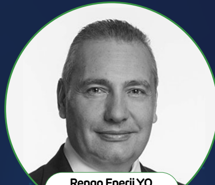
Rengo Enerji YO