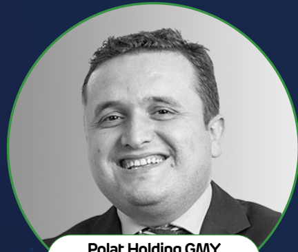
Polat Holding GMY