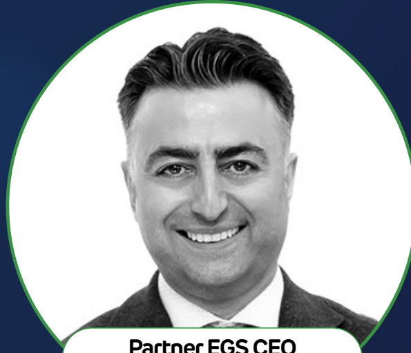
Partner EGS CEO