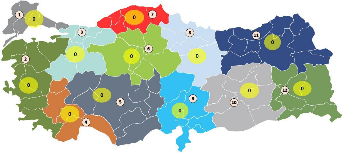
3-ANA KAYNAĞI RÜZGAR VEYA GÜNEŞ ENERJİSİ OLAN ÜRETİM LİSANSI SAHİPLERİ TARAFINDAN YAPILACAK ELEKTRİKSEL GÜÇ ARTIŞ TALEPLERİ İÇİN KAPASİTELER (MW)